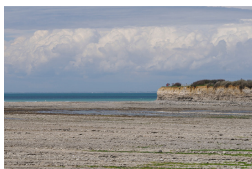
Approche sensible Sylvain Lamorte, «A marée basse», Ile d'Oléron, 2016