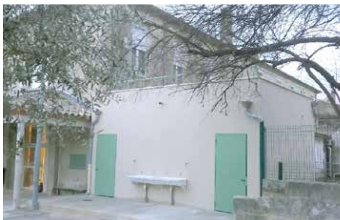
Nouveau bloc sanitaire à l'école élémentaire