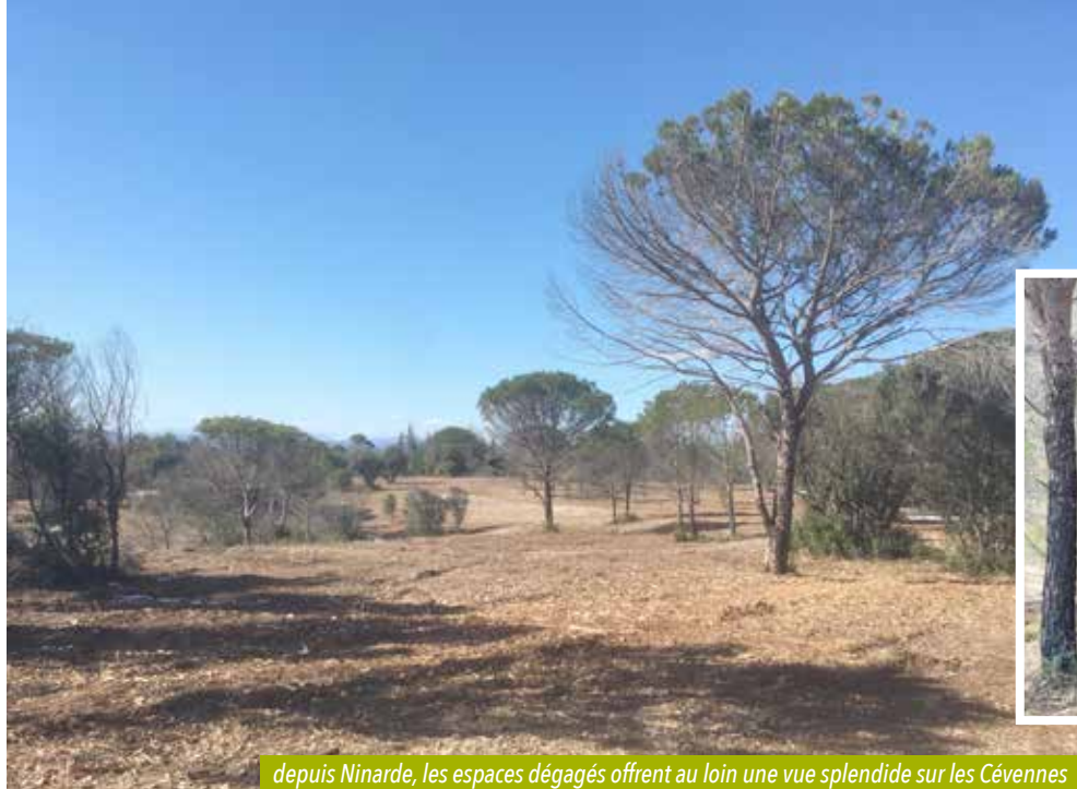
depuis Ninarde, les espaces dégagés offrent au loin une vue splendide sur les Cévennes