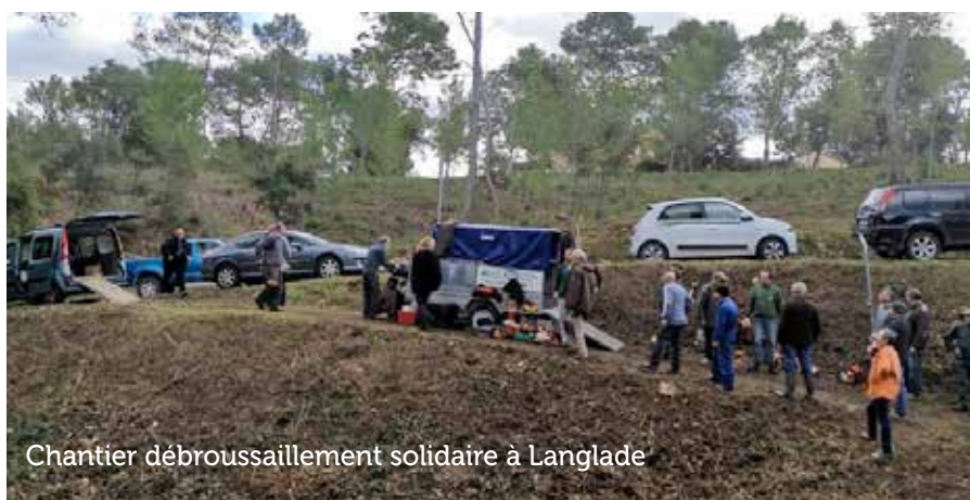
Chantier débroussaillage solidaire à Langlade

Contact Mairie : 04 66 80 70 87 mairie.congenies@wanadoo.fr